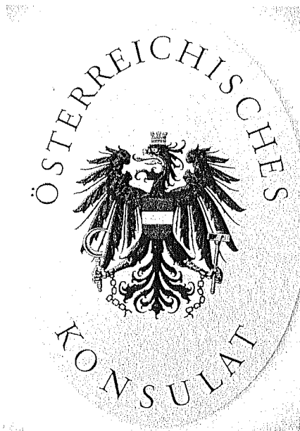
Seit 2004 hängt der Adler am St. Johanner Markt in Saarbrücken.